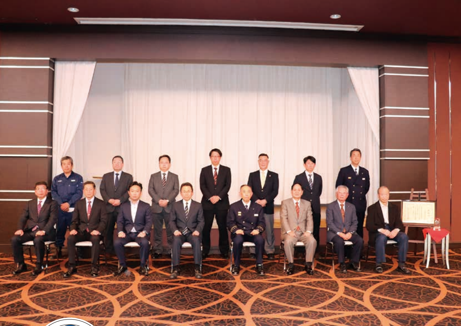
令和3年防災功労者防災担当大臣表彰伝達式