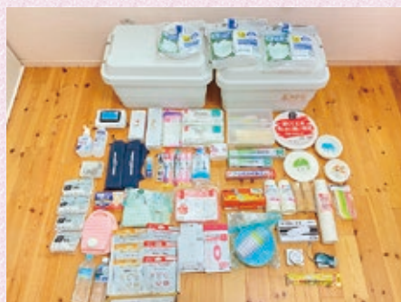
わが家の防災備蓄