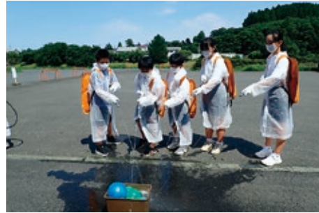
ジェットシューターによる消火訓練

参加したクラブ員は、新しい仲間を得てはつらつと過ごし充実した研修となったようでした。