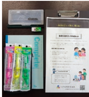
防災マップ作成キット

防災意識を育む目的で実施しているこの研修では、少年消防クラブのリーダーとしての協調性や指導力を身につけ、防火・防災の知識や災害対応力向上のため、救急訓練、消火訓練、濃煙体験などを実施しました。